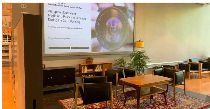
Biblioteka Uniwersytetu w Oslo, late night writing sessions odbywają się tutaj